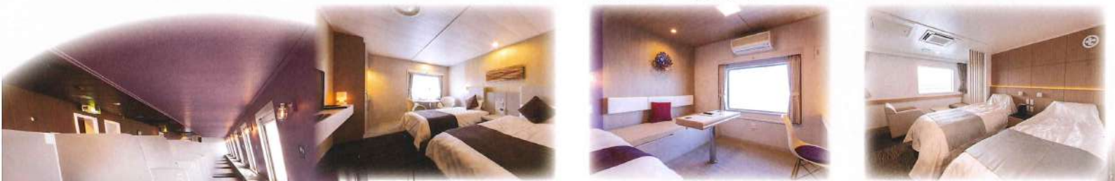
女性専用ルームあり